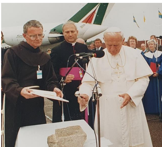
Påve Johannes Paulus II välsignar stenen....