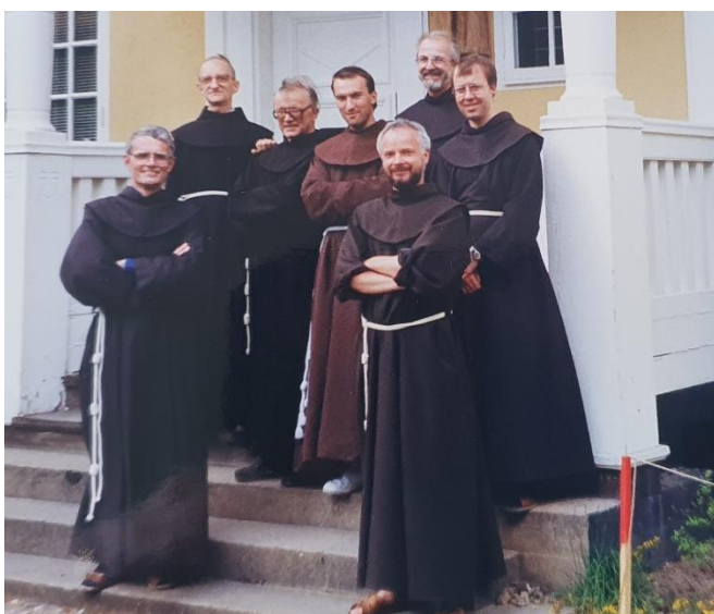
Franciskankommuniteten på 80-talet