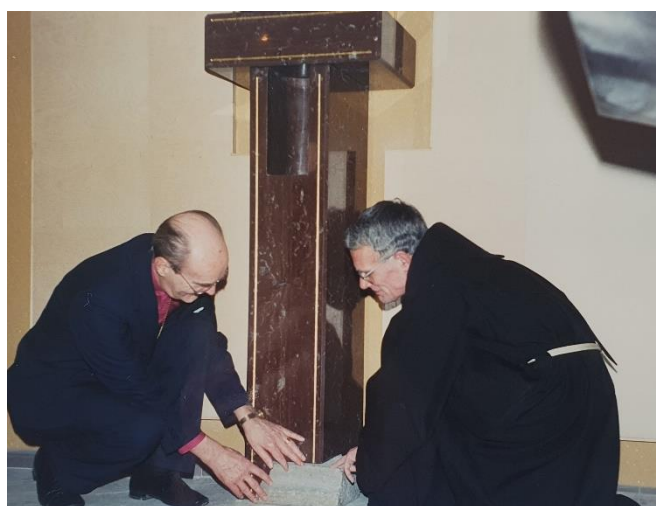
....som sedan byggs in vid Tabernaklet